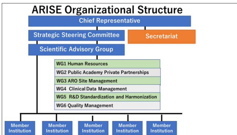
図1 ARISE 組織体制図