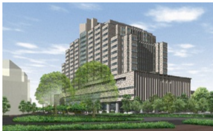
戸山地区 (東京都新宿区)

対象組織 国立国際医療研究センター 戸山地区 (センター病院等) 国府台地区 (国府台病院等) 清瀬地区 (国立看護大学校)