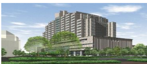
センター病院（新宿区）

具体的には、新興・再興感染症及びエイズ等の感染症、糖尿病・代謝性疾患、肝炎・免疫疾患ならびに国際保健医療協力を重点分野とし、我が国のみならず国際保健の向上に寄与するため、主要な診療科を網羅した総合的な医療提供体制の下で、国際水準の医療を創出・展開し、チーム医療を前提とした全人的な高度専門・総合医療の実践及び均てん化ならびに疾病の克服を目指す研究開発を推進する所存です。