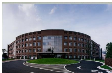
国立看護大学校（清瀬市）