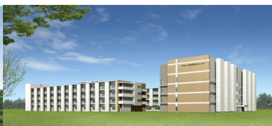
国府台病院（市川市）