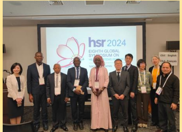
シンポジウム登壇者・関係者